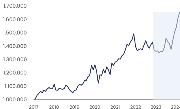
Rentabilidad desde inclusión de Activos Alternativos

Si hubieras invertido $1.000.000 en este portafolio hace 12 meses, tu resultado sería $1.226.918 (1)